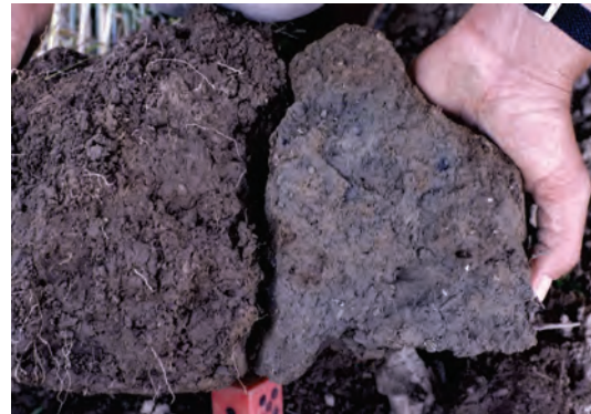
Abb. 48: Links: Bodenprobe außerhalb der Spur. Rechts: Bodenprobe in der Spur (graublau verfärbt)