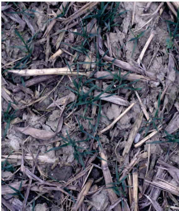
Abb. 26: Auf der Bodenoberfläche belassene, allenfalls flach eingearbeitete Ernterückstände schützen vor Verschlammung und Oberflächenabfluss. Im Bild: Pfluglos bestellter Winterweizen nach Körnermais; die Grundbodenbearbeitung erfolgte mit dem Grubber.