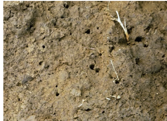
Abb. 52: Zahlreiche Regenwurmröhren an der Grenze der Bearbeitung (Pflugsohle); Sicheres Kennzeichen, dass der Unterboden nicht gelockert werden darf