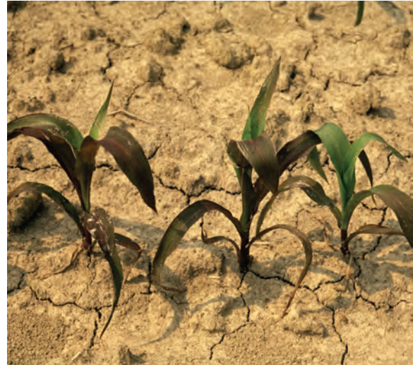
Abb. 6: Ernährungsstörung (Phosphatmangel?) bei Mais als Folge von Oberflächenverschlammung und damit einhergehender Behinderung des Gasaustausches