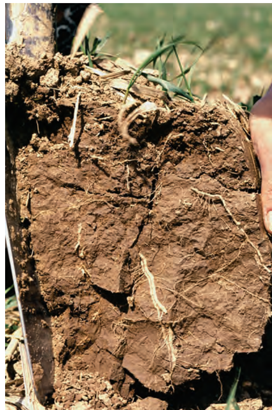
Abb. 40: Grobprismatisches Gefüge (Gefügenote 4) aus der stark verdichteten Unterkrume einer langjährig nicht gepflügten Parabraunerde aus Löss. Die Wurzeln sind durch den Quellungsdruck platt gepresst.