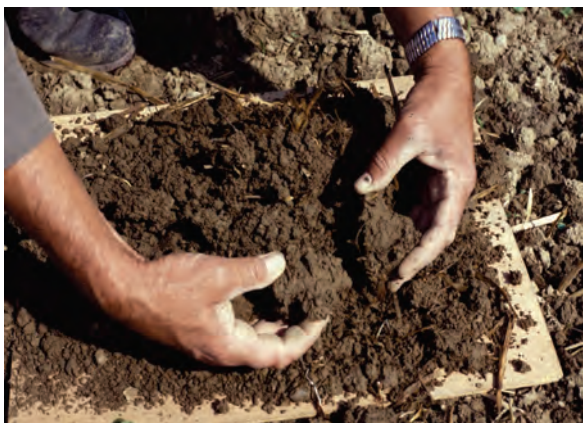
Abb. 14: Beim behutsamen Zerteilen werden Gefügeform, Farbe und Wurzelbild registriert