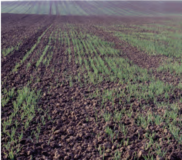
Abb. 5: Ungleichmäßiger Aufgang der Wintergerste aufgrund mangelnden Bodenschlusses durch ein zu grobes Saatbett