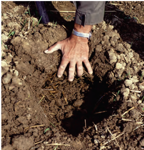
Abb. 11: Ausheben des Bodenblocks: Die eine Hand betätigt den Spaten als Hebel, die andere hält den Bodenblock auf dem Spatenblatt