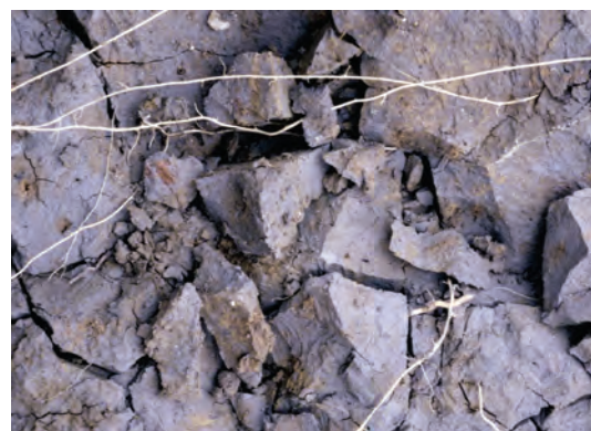
Abb. 49: Graue Grundfarbe und Rostflecken zeigen Luftmangel eines Gleybodens durch Grundwassereinfluss