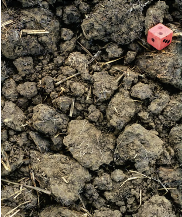
Abb. 33: Bröckelgefüge sind typische Gefügestrukturen der Unterkrume (Gefügestufe 2-3)