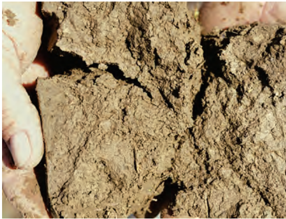
Abb. 29: Kohärentgefüge, ungünstig (Gefügestrukturnote 4), stark verdichteter Lössboden aus einer Fahrgasse