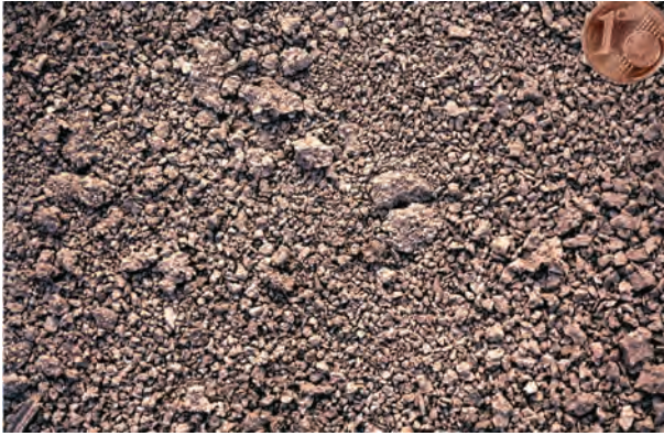
Abb. 37: Feinpolyederggefüge (Gefügezzone 2) an der Oberfläche eines Tonbodens (Froststruktur)

Polyederggefüge sind typisch für tonige Böden. Man erkennt sie an ihren scharfen Kanten und glatten Oberflächen. Wasserbewegung, Durchlüftung und Durchwurzelung spielen sich auf den Oberflächen der Gefügekörper ab. Deshalb sind die Polyederggefüge umso besser zu beurteilen, je kleiner die Gefügekörper sind. Prismen- und Plattengefüge sind Grobpolyederggefüge mit vorherrschend vertikaler bzw. horizontaler Klüftung.