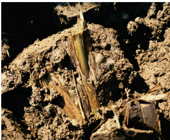
Abb. 53: Nass eingepflühtes, unverrottetes Maisstroh im Sommer des folgenden Jahres: Alarmzeichen für schlechte Bodenstruktur (schlechte Durchlüftung)