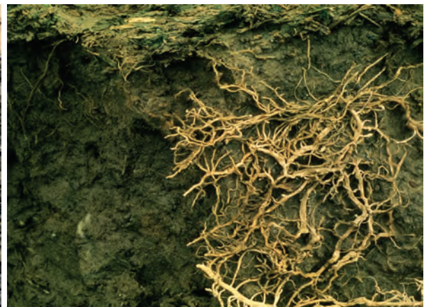
Abb. 43: Wurzelfilz auf einer Kluftfläche eines dichten, sonst kaum durchwurzelbaren Kohärentgefüges (sehr ungünstig)