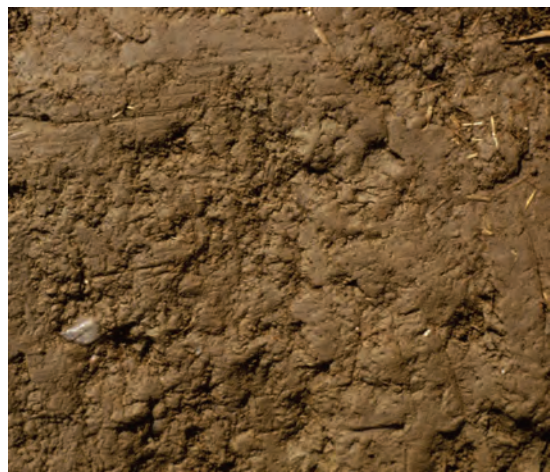
Abb. 54: Fehlen von Wurmlöchern und Klüften und dichtes Kohärenzgefüge lassen eine Unterbodenlockerung geraten erscheinen