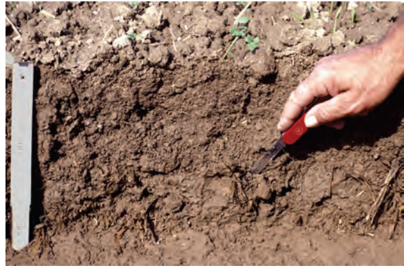
Abb. 17: Freilegung der Krume: Mit einem Taschenmesser werden der Übergang von Ober- zu Unterkrume, Verdichtungen, organische Reste u. a. sondiert