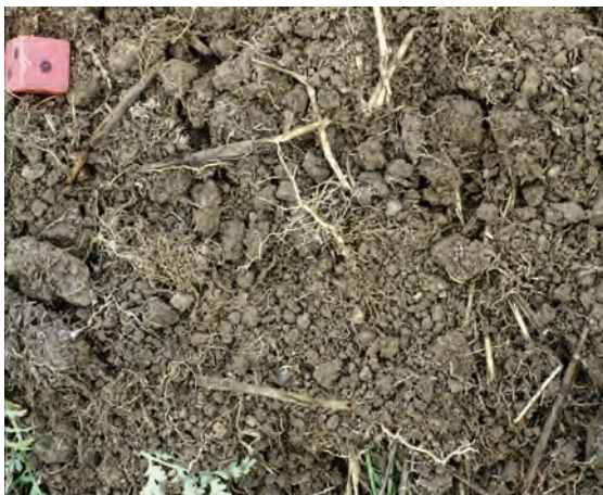
Abb. 31: Krümelgefüge aus der Oberkrume eines Zwischenfruchtbestandes (Abwurfprobe)