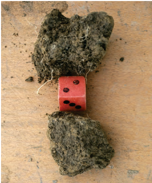
Abb. 35: Je nach Porosität und Festigkeit erhalten Bröckel die Gefügestufe 2 oder 3; oben: lockerer, poröser Bröckel (2) unten: dichter, fester Bröckel (3)