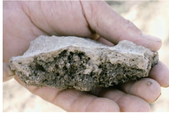
Abb. 25: Das Bild zeigt die verschlammte Schicht in Nahaufnahme. Derartige Schichten werden bei Austrocknung steinhart (Krusten) und sind für Feinsämereien, wie Zuckerrüben nahezu undurchdringlich