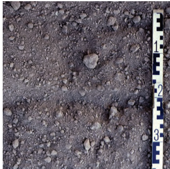
Abb. 23: Lösslehm Boden, saarfertig: Durch dreimaliges Überfahren mit der Eggen-Krümler-Kombination ist das Saatbett zu fein geworden. Verschlammungsgefahr!