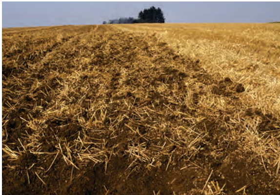
Abb. 51: Gleichmäßige, flache Stroheinarbeitung unmittelbar nach der Ernte fördert die Rote und vermeidet beim späteren Pflügen die „Matratzenbildung“