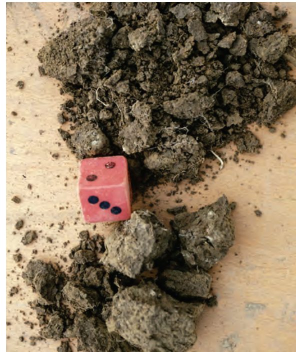
Abb. 36: Zerfall der abgebildeten Bröckel bei Druck (der rote Würfel hat eine Kantenlänge von 3 cm)