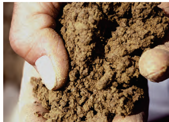
Abb. 15: Durch Zerdrücken mit der Hand werden Festigkeit und Zerfall der größeren Aggregate geprüft