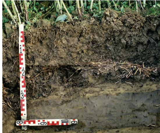
Abb. 50: „Strohmatratzen“ werden von den Wurzeln gemieden und behindern die Wasserbewegung

Klüfte und Röhren in der Pflugsohlschicht geben Hinweise, ob eine Unterbodenlockerung Erfolg verspricht.