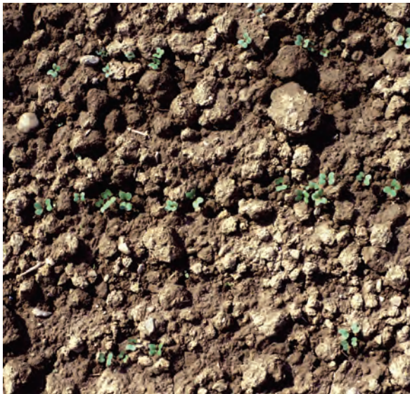
Abb. 22: Bodenoberfläche zwei Wochen später: Die Rapssaat ist gut aufgelaufen. Die relativ „raue“ Bodenoberfläche schützt die jungen Pflänzchen