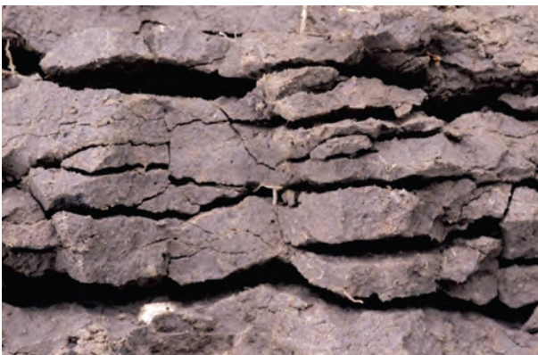
Abb. 39: Plattiges Gefüge (Gefügenote 4): Nicht bearbeitete Unterkrume einer Lössparabraunerde