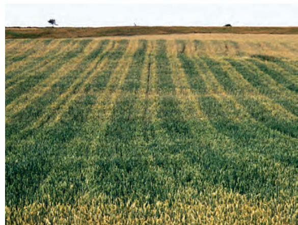
Abb. 4: Vorzeitige Abreife des Getreides auf den bei der Bestellung verursachten Verdichtungen in den Fahrspuren (Wassermangel)