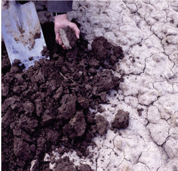
Abb. 24: Stark verschlammter Lösslehm Boden, Schluff- und Tonteilchen haben sich entmischt. Die gute Krümenstruktur ist durch eine wenige Millimeter dicke Schluffschicht versiegelt. Gasaustausch und Infiltration sind stark behindert. Der Boden ist stark erosionsgefährdet.