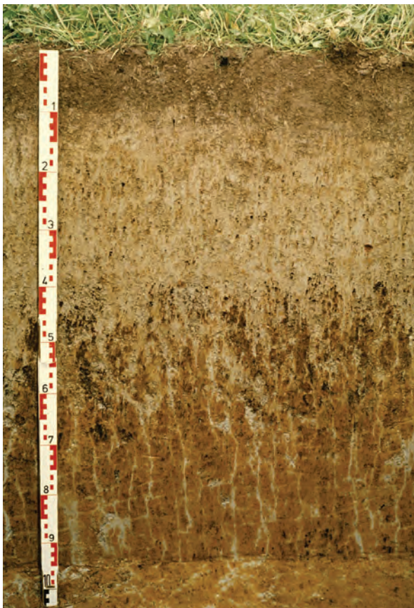
Abb. 46: Die hell gefärbte Schicht mit schwarzen, harten kugeligen Einschlüssen (Konkretionen) im oberen Teil des Bodenprofils weist auf Wechsel zwischen Austrocknung und Vernässung hin; Rostfärbung und graue Marmorierung sind kennzeichnend für den dichtgelagerten, wasserstauenden Untergrund (Pseudogley aus Lösslehm)

Färbung und Farbmuster eines Bodens stehen in enger Beziehung zur Wirksamkeit des Porensystems. Gleichmäßig braune Farben zeigen eine für das Pflanzenwachstum ausreichende Durchlüftung an. Blaugraue Farben, Rostflecken und Konkretionen sind Anzeichen für Nässe. Übler Geruch kommt von Fäulnisprozessen und ist ein Indiz für starke Verdichtung.