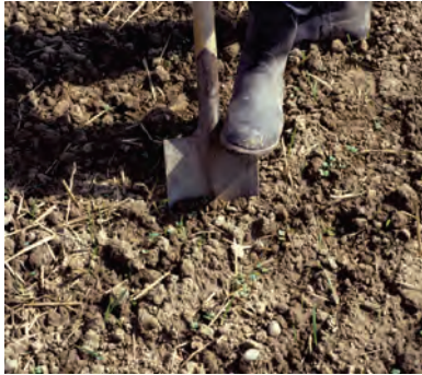
Abb. 8: Einstecken des Spatens: Der Eindringwiderstand lässt bereits auf die Dichtlage schließen