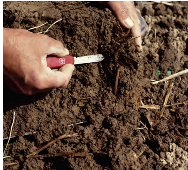
Abb. 12: Vorsichtiges Zerlegen des Bodenblocks mit den Händen oder einem Taschenmesser