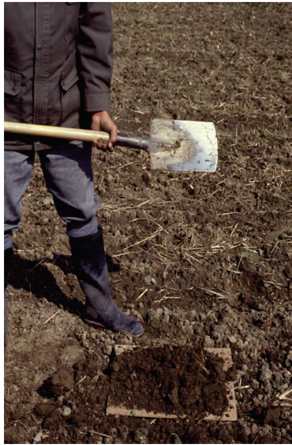
Abb. 13: Beim Aufprall auf eine feste Unterlage (Brett) zerfällt der Bodenblock in seine natürlichen Gefügeaggregate