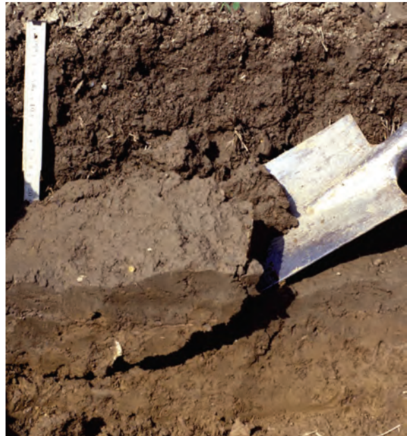
Abb. 19: Ausstechen eines Bodenblocks im Bereich der Pflugsohle: Im Bild ist eine verdichtete, verlassene Krumenschicht erkennbar