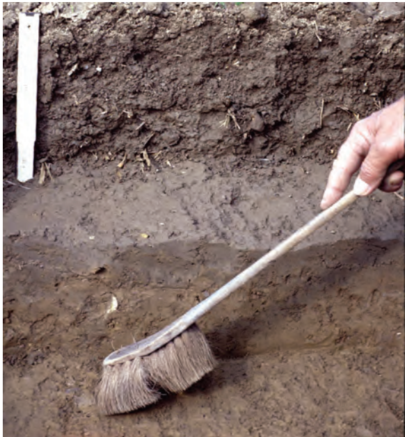
Abb. 18: Freilegen der Pflugsohle und des tiefen Unterbodens durch stufenweises Tiefergraben: Durch vorsichtiges Auskehren wird nach Röhren und Klüften gesucht