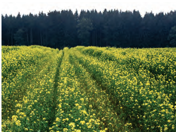
Abb. 3: Ungleichmäßiger Zwischenfruchtbestand aufgrund von Bodenverdichtung in den Fahrspuren der Gülleausbringung