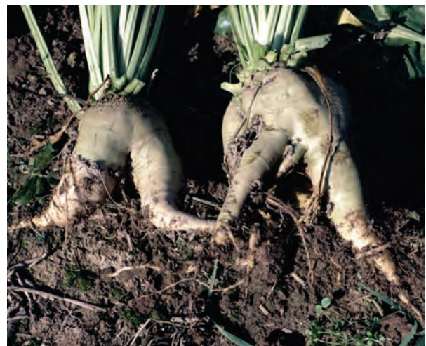
Abb. 45: Beinige Rüben als Folge starker Verdichtungen in der Unterkrume (ungünstig)