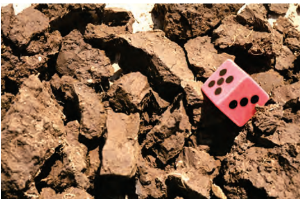
Abb. 38: Mittel- bis grobpolyedrisches Gefüge (Gefügenote 3-4): Bei Lehm Böden weisen polyedrische Gefügestufen stets auf Verdichtungen hin

Polyederggefüge sind typisch für tonige Böden. Man erkennt sie an ihren scharfen Kanten und glatten Oberflächen. Wasserbewegung, Durchlüftung und Durchwurzelung spielen sich auf den Oberflächen der Gefügekörper ab. Deshalb sind die Polyederggefüge umso besser zu beurteilen, je kleiner die Gefügekörper sind. Prismen- und Plattengefüge sind Grobpolyederggefüge mit vorherrschend vertikaler bzw. horizontaler Klüftung.