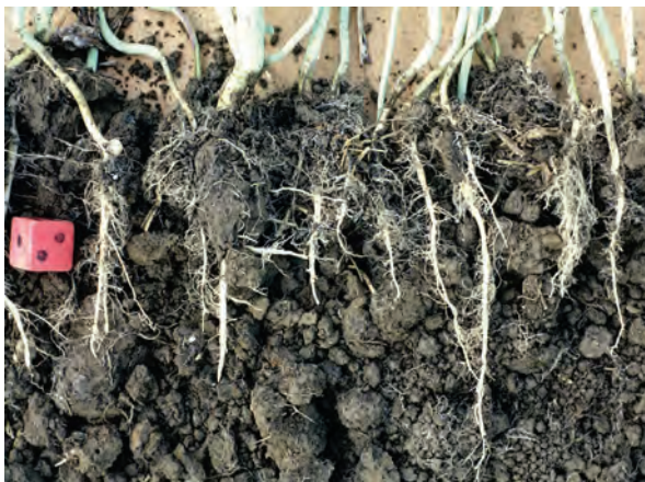
Abb. 42: Ungestörte Tiefendurchwurzelung in einem krümelig bröckeligen Gefüge (günstig) - Abwurfprobe