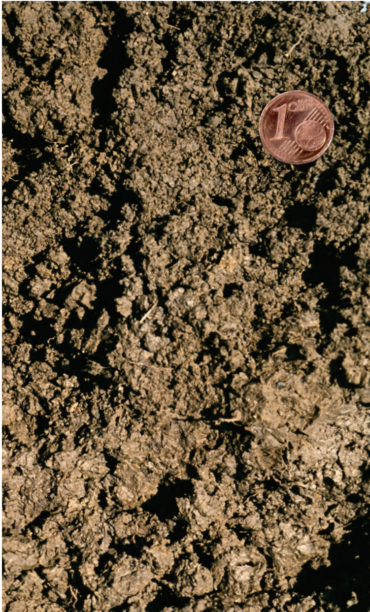
Abb. 1: Bodengefüge

Unter der Bodenstruktur oder dem Bodengefüge versteht man die räumliche Anordnung der festen Bodenbestandteile.