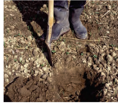
Abb. 10: Der auszuhebende Bodenblock wird durch seitliches Einstecken abgegrenzt