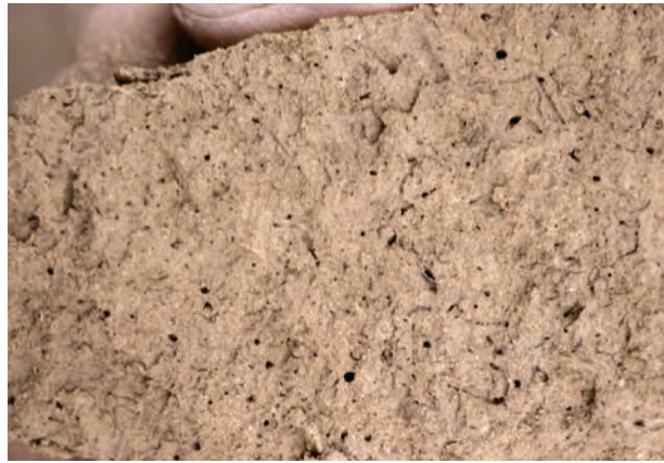
Abb. 30: Kohärentgefüge, günstig (Gefügestrukturnote 2), Löss in ursprünglicher Lagerung, locker, zahlreiche Grobporen