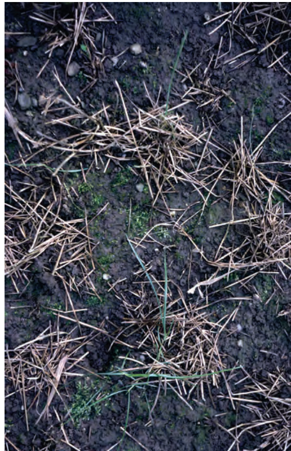
Abb. 27: Regenwürmer versuchen, das an der Oberfläche belassene Strohhäcksel in ihre Wohnhöhle zu ziehen. Dadurch entstehen die eine lebhaft Regenwurmaktivität anzeigenden Strohhäufchen. Unter jedem Strohhäufchen befindet sich eine Wohnröhre