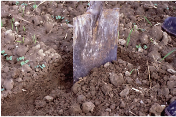
Abb. 16: Freilegung der Bestellschicht: Sie gibt Auskunft über den Bodenschluss und eine eventuelle Oberflächenverschlümmung