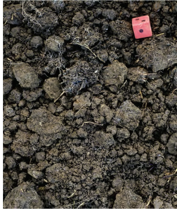
Abb. 34: Mischgefüge aus etwa 50% Krümeln und 50% Bröckeln (Gefügestufe 1,5)