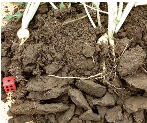
Abb. 44: Gehemmte Durchwurzelung durch plattiges Gefüge an der Untergrenze der bearbeiteten Schicht (ungünstig)