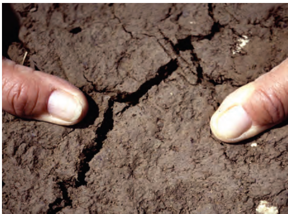
Abb. 20: Aufbrechen des Bodenblocks mit den Händen: Der Kraftaufwand steigt mit der Dichtlagerung