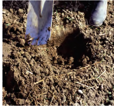
Abb. 9: Der Auswurf des Spatenstichs gibt einen ersten Hinweis auf die Gefügestruktur