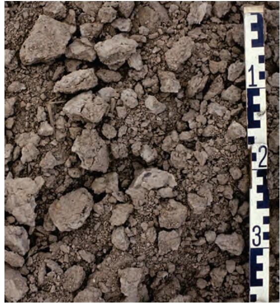
Abb. 21: Lösslehm Boden, saarfertig: Einmaliges Bearbeiten mit Eggen-Krümler-Kombination schafft ausreichend Feinboden für die Einbringung der Saat. Die groben Gefügeaggregate wirken der Verschlammung und dem Oberflächenabfluss entgegen

Leicht zu Verschlammung neigende Böden (schluffreiche Böden, Lössböden) dürfen nicht zu fein bearbeitet werden. Den besten Schutz vor Verschlammung (und Erosion) bietet eine Bodenbedeckung durch Pflanzen oder Ernterückstände.