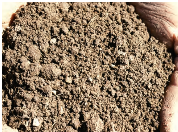
Abb. 32: Krümelgefüge aus einer Grünlandkrume; ideales Gefüge (Gefügestrukturnote 1)