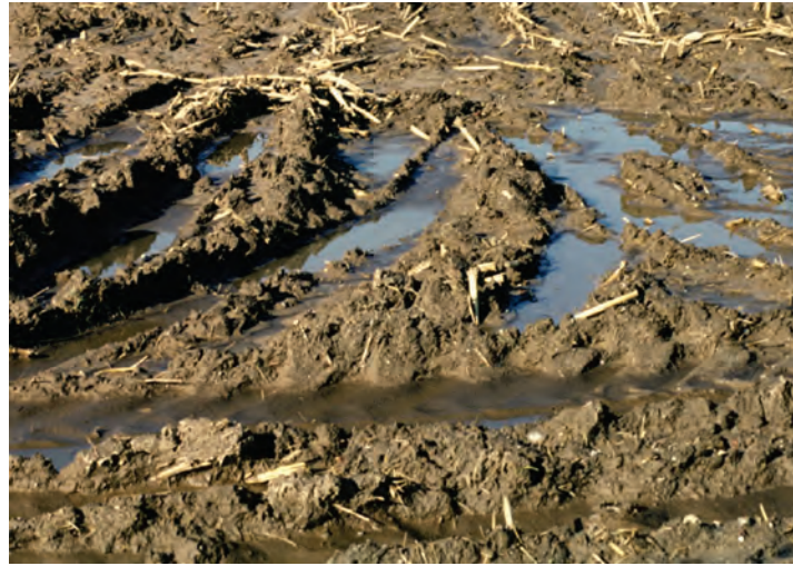
Abb. 2: Starke Bodenverdichtung und gehemmte Wasserfiltration in den Fahrspuren nach Silomaiserte bei feuchtem Boden

War in der Vergangenheit Nährstoffmangel der wichtigste ertragsbegrenzende Faktor, so ist es heute nicht selten eine mangelhafte Bodenstruktur. Die Abbildungen auf dieser Seite zeigen Beispiele, wie sich Strukturschäden an der Bodenoberfläche bemerkbar machen können.