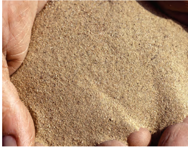
Abb. 28: Einzelkorngefüge. Die Mineralkörner liegen lose nebeneinander, geringes Wasserhaltevermögen (Gefügestrukturnote 3)

Die Gefügestruktur eines Bodens hängt zum Teil von seinem Ausgangsmaterial ab, zum Teil ist sie jedoch bewirtschaftungsbedingt. Das für die Krume anzustrebende Gefüge ist das Krümelgefüge, der „gare Boden“, Humus- und Kalkversorgung, eine gesunde Fruchtfolge und eine schonende Bearbeitung fördern seine Entstehung. Zunehmende Verdichtungen führen zu einer Abnahme der Grobporen und einer Zunahme der ungegliederten oder groben Gefügestrukturen.