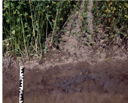
Abb. 47: Graublau, übelriechende Verfärbungen (Reduktionszonen) sind die Ursache für das Misswachstum der Rapszwischenfrucht. Sie entstanden durch Bodenverdichtung in der Schlepperspur bei der Gülleausbringung und nachfolgendes Unterpflügen der Gülle.